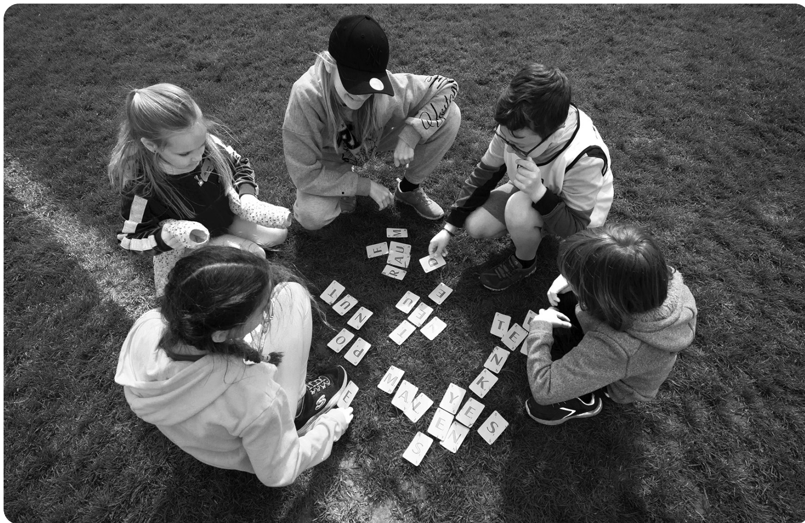
Draussen spielerisch lernen: Was den Kindern gefällt, fördert nachweislich den Lernprozess.

zur Verfügung, wie Checklisten oder Vorlagen für Infobriefe, die ihnen die Organisation möglichst erleichtern soll. Auch finanziell werden die Exkursionen von der Stadt unterstützt. Die Erziehungsberechtigten müssen bei Bedarf nur einen Minimalbeitrag beisteuern.